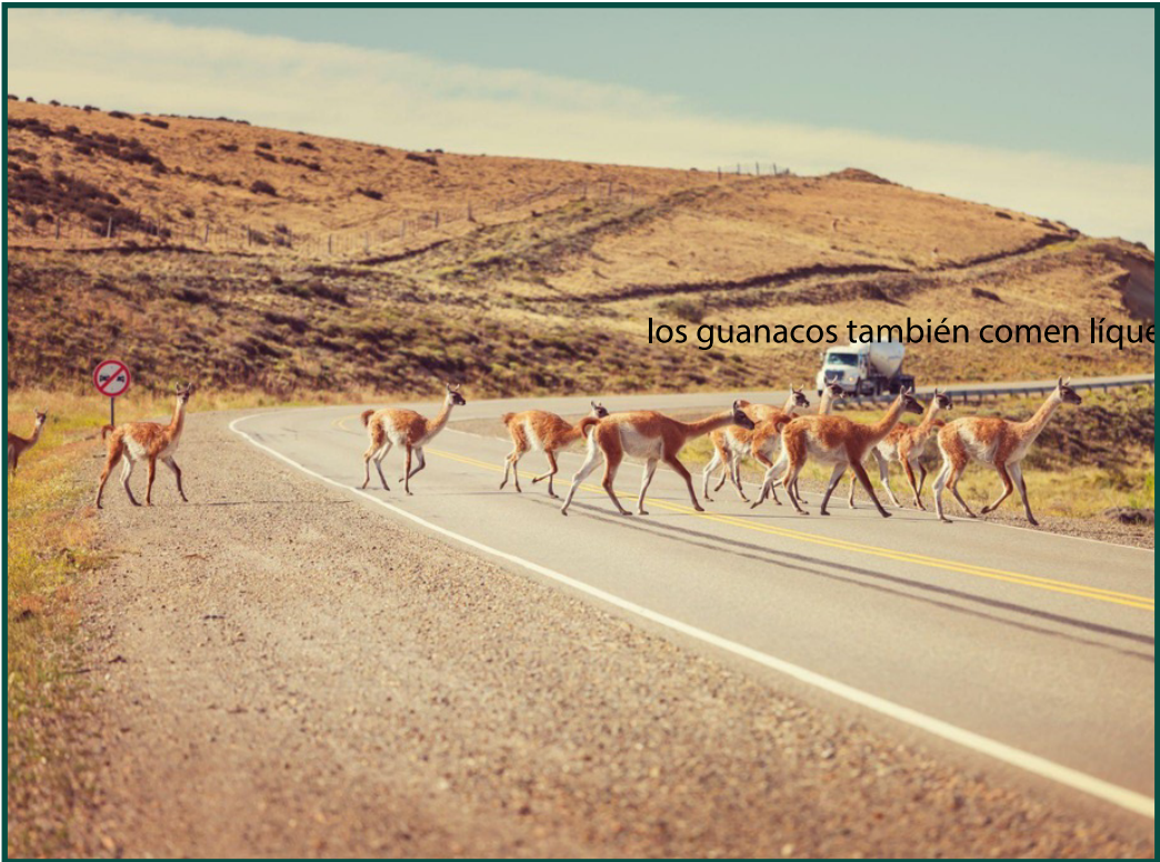
los guanacos también comen líquenes